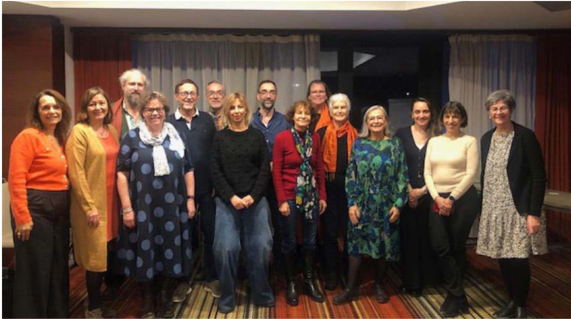
Специальный экзамен, Лондон, Илинг, 10-11 ноября 2022 г.