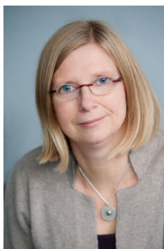
Майке Вагнер-Фробёз Председатель, делегат Германии