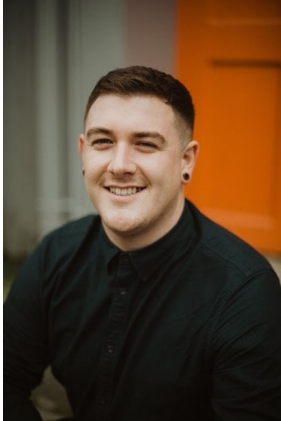
Джон Флеминг, автор движения DEIA, кооптированный член Ирландия